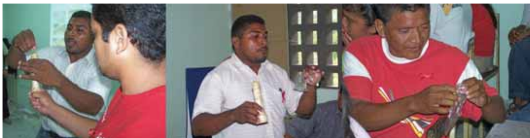
Taller sobre prevención del VIH y uso del condón, comunidad indígena Yukpa, Venezuela @ AMAVIDA 2007