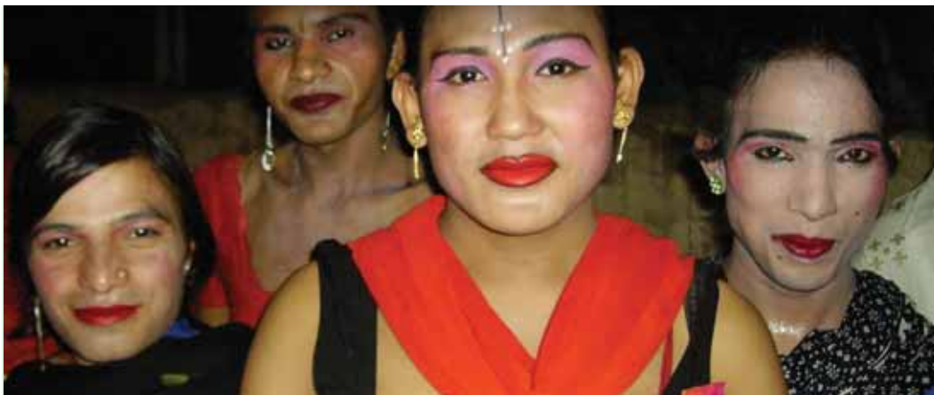
'Khote' / trabajadoras sexuales transgénero en una parada de camiones